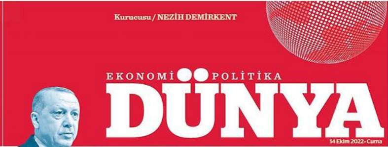
14 Ekim 2022 - Cuma